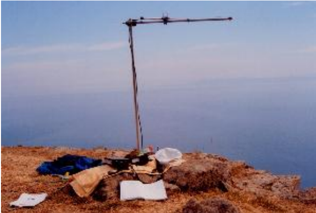
L' antenna. Un grazie al mio sponsor: Giorgio IZ4BZB che mi ha prestato apparato, antenna, rosmetro, cavi ecc.