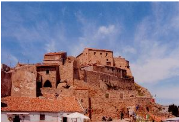
Il castello. Ecco il castello di Isola del Giglio. Siamo a circa 400m d'altezza ed il panorama è stupendo.