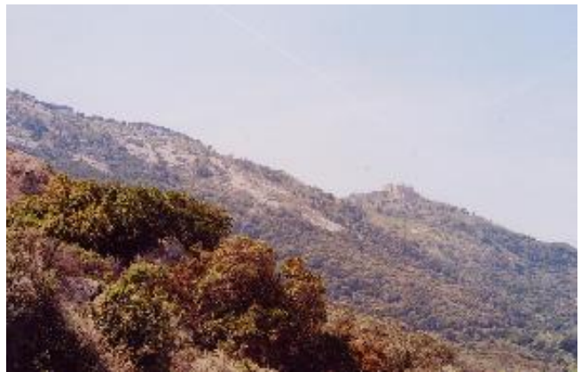
Il castello dall'imbocco del sentiero Le poche ore di attivazione sono finite. Si torna a casa ma in corriera.

Grazie a tutti coloro che hanno avuto la pazienza di collegarmi. Al prossimo castello.