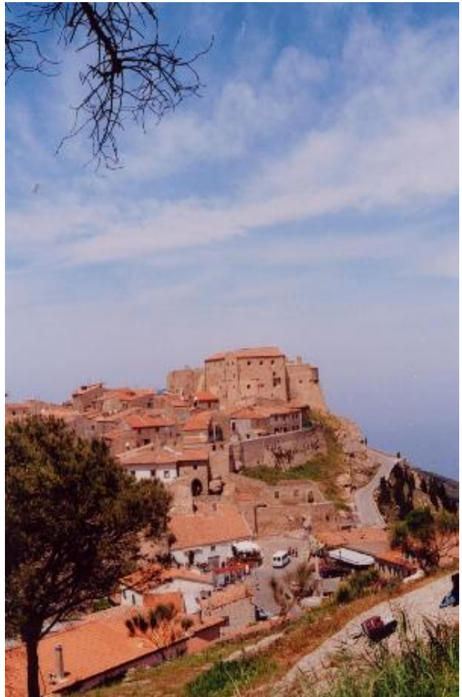
Il castello con il paese. Castello e paese sono un tutt'uno. Un dedalo di vie forma l'antico borgo medievale.