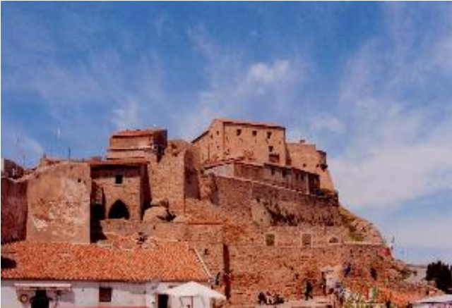
Il castello. Ecco il castello di Isola del Giglio. Siamo a circa 400m d'altezza ed il panorama è stupendo.